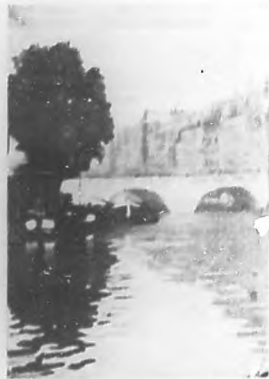
Pont Saint-Michel, Paris.

Jaurés; pero sin el arte no hay bien. Y esta es la ocasión para felicitar al Senado de Cuba por la atención y apoyo decidido que ha prestado