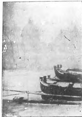
Nota de invierno, Paris.

cad en las tumbas de los progenitores de la vida á la libertad, y decidies, preguntadles si eran prácticos ó soñadores. Y como la piedra habla cuando nosotros queremos que hable, ella dirá lo que somos ahora, por adoptar las formas del