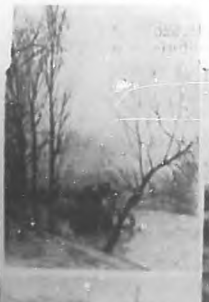
Paisaje de invierno.—Barcas en el "Sena".