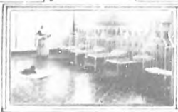
INAUGURACION DE LA "CRECHERIE" EN EL CERRO...