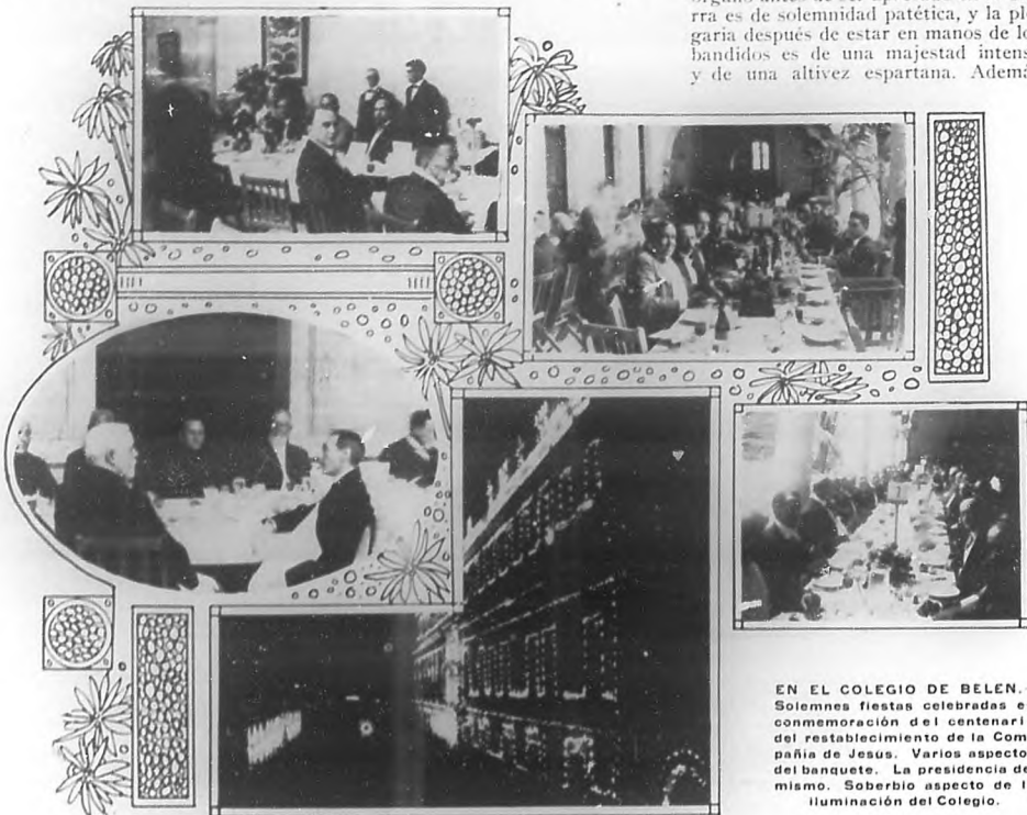
EN EL COLEGIO DE BELÉN.—Solemnes fiestas celebradas en conmemoración del centenario del restablecimiento de la Compañía de Jesús. Varios aspectos del banquete. La presidencia del mismo. Soberbio aspecto de la iluminación del Colegio.

Don Quijote en Nueva York.—No hay que asustarse