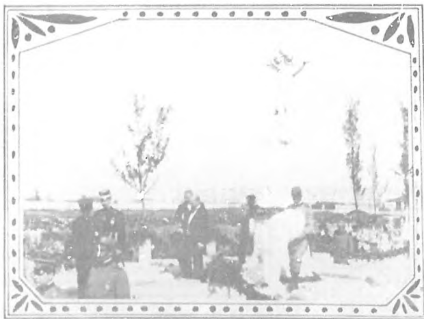
EL PANTEON DE LA POLICIA NACIONAL