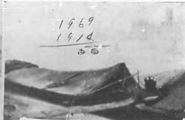
Barca de frutas en el "Sena".

al proyecto de ley de reformas en la Academia de Arte de la Habana.