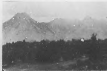
Paisaje de Asturias.

cad en las tumbas de los progenitores de la vida á la libertad, y decidies, preguntadles si eran prácticos ó soñadores. Y como la piedra habla cuando nosotros queremos que hable, ella dirá lo que somos ahora, por adoptar las formas del