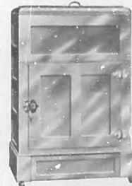
5 tamaños con Tanque $45 a $100, M. O.

NO PONGA EN PELIGRO SU SALUD CON NEVERAS DE MADERA